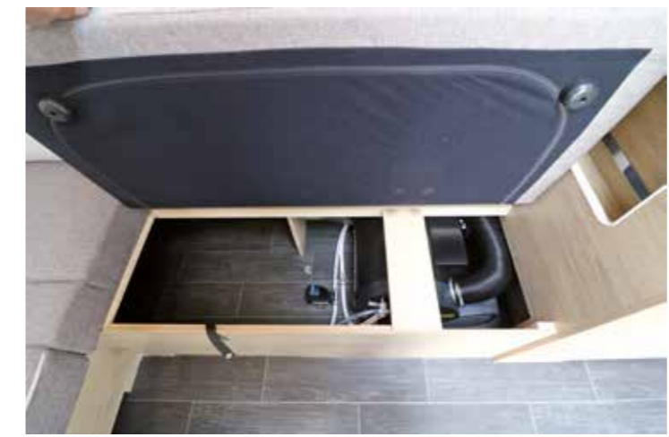
Die leistungsstarke Truma Combi-6-Heizung befindet sich gut erreichbar in der linken Sitzruhe

auf 2.000 Kilogramm bleiben satte 394 Kilogramm an Zuladung für Ausrüstung, Gepäck und Vorräte übrig. Damit sollte ein Zweipersonenhaushalt zurechtkommen, zumal auch noch Luft für individuelle Ausstattungswünsche bleibt.