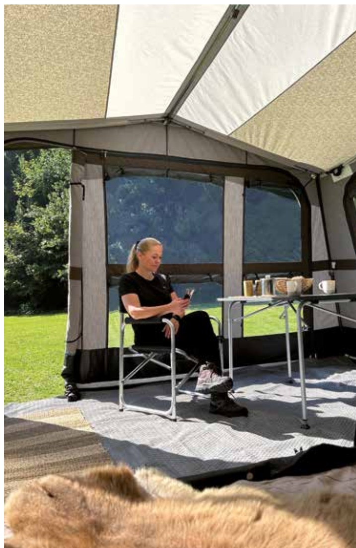
Genuss unterwegs im neuen Camp-let-Faltcaravan Earth

Zu finden ist der Neue „Earth“ unter https://www.isabella.net/de/camp-let-faltcaravan im Internet.