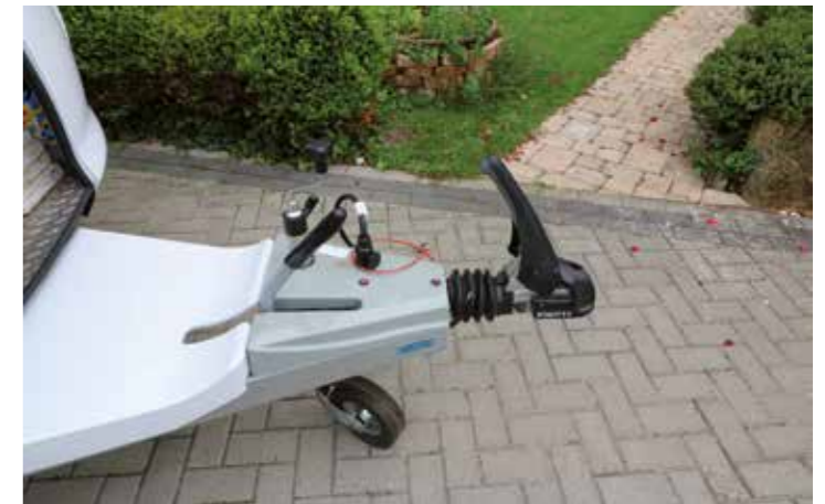
Saubere Deichselverkleidung und die leicht bedienbare Knott-Antischlingerkuppelung können auf Anhieb überzeugen

Unser nächster Kandidat ist der Fendt Diamant