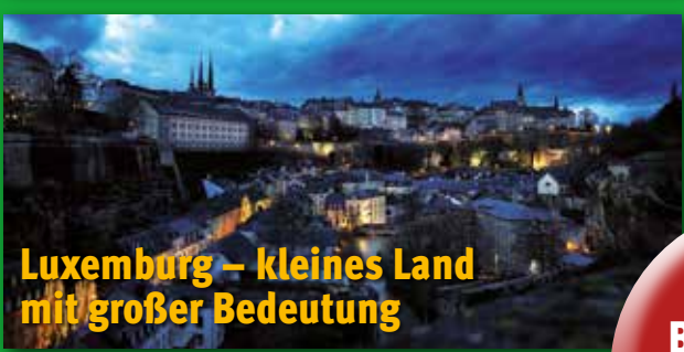
Luxemburg – kleines Land mit großer Bedeutung