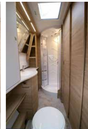
Klasse Dusche mit ausreichend Platz und sicher schließender Kunststofftür

Seiten bequem zugänglich ist. Ebenso praktisch sind die zahlreichen Ablagen sowie der mittig platzierte TV-Platz mit der variablen Schwenkhalterung.