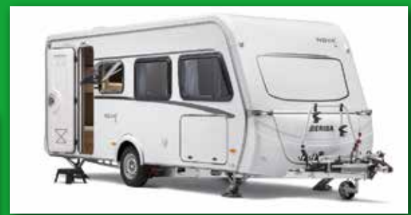
Baureihe kompakt: Eriba Nova Light