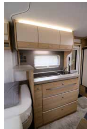
Die Küche mit dem Thekenaufsatz überzeugt mit adretter Optik, viel Stauraum und kompletter Ausstattung

Auch in diesem Modell kommt der multifunktionale Hochschrank neben der Eingangstür zum Einsatz. So ist es möglich, dass der 133-l-Kühlschrank durch die doppelt angeschlagene Tür von beiden