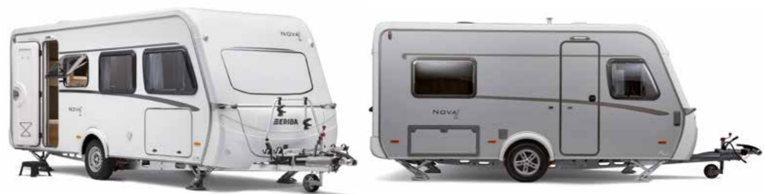
Kompakt unterwegs der Nova Light von Eriba