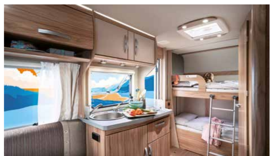
Die kompakten Küchen enthalten alle den 81-l-Absorber-Kühlschrank