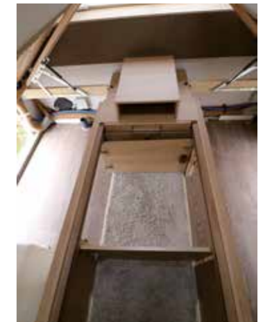
Durch die beidseitigen Außen- und Innenklappen entsteht eine praktische Durchladefunktion