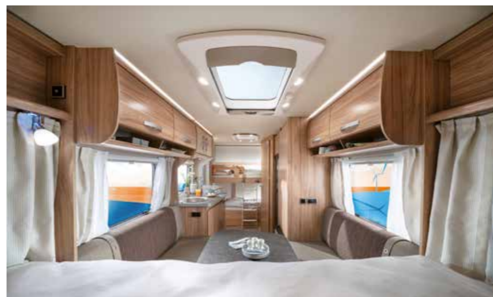
Blick vom Bug zum Heck im familienfreundlichen Nova Light 515

sertank. Ansonsten präsentiert sich die Karosse im automotiven Erscheinungsbild mit nur einigen Design-Aufklebern. Am Heck sorgt das formschöne Kunststoff-Element mit den markanten Rundleuchten am Heck und dem durchgehenden Rangierbügel für den gewünschten Wiedererkennungswert der Marke.