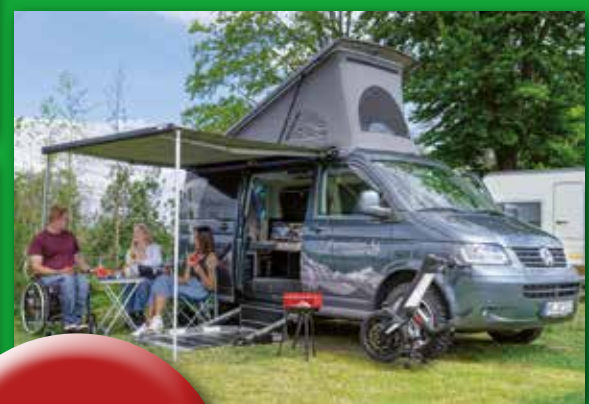
Reisen mit Handicap