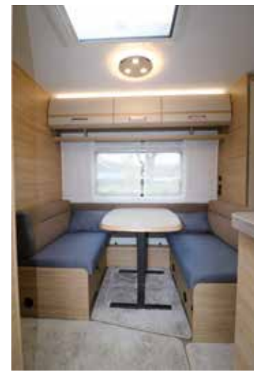
Die Gegensitzgruppe mit dem funktionalen Hubtisch bietet gute Platzverhältnisse für zwei Personen