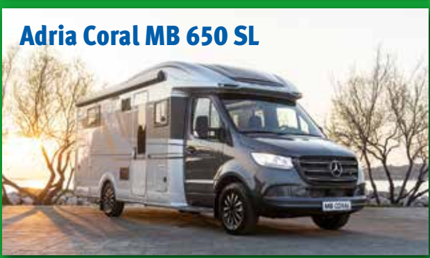
Adria Coral MB 650 SL

In Bad Reichenhall liegt Salz in der Luft