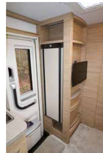
Funktionaler Hochschrank mit Kühlschrank, TV-Platz und diversen Ablagen