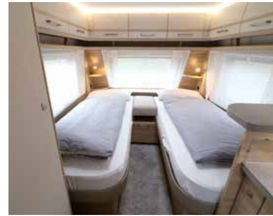
Das Bugschlafzimmer mit den komfortablen Betten kann auf Anhieb gefallen

Zu erwähnen ist die funktionelle Querladefunktion der Bettkästen durch die beidseitigen Außen- und Innenklappen, sodass auch längere Gegenstände bequem verstaut werden können.