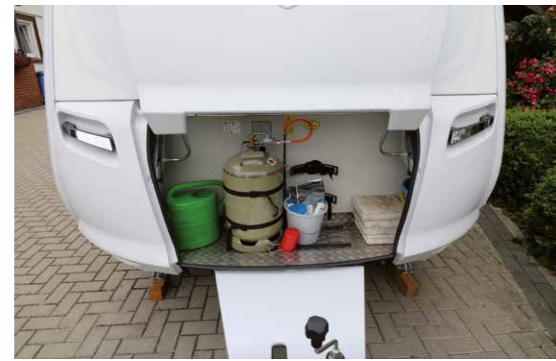
Saubere Deichselverkleidung und die leicht bedienbare Knott-Antischlingerkuppelung können auf Anhieb überzeugen

Fazit Der klar strukturierte Grundriss des Pantiga 550 E bietet einem designorientierten Paar in allen Bereichen viel Platz, ein angenehmes Raumgefühl sowie ein modernes Wohnambiente. Dazu überzeugt das hohe Qualitätsniveau von Einrichtung und Aufbau, das während der halbjährigen Testdauer keinerlei Anlass zur Kritik gab. Auf der Habenseite