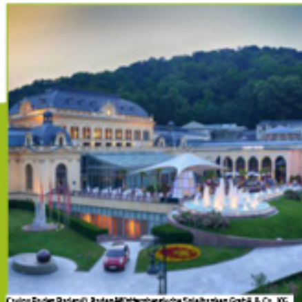
Casino Baden Baden

In Kehl schätzt und pflegt man die badische Küche, in Straßburg die elsässische - Feinschmecker können auf beiden Rheinseiten ihre Gaumen verwöhnen lassen. Spezialitäten sind Spargel im Frühsommer, Flammkuchen, Flussfische oder Roastbeef.