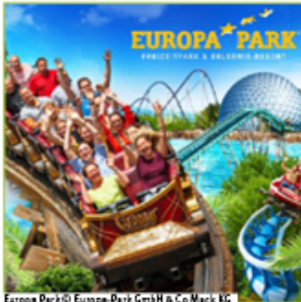
Europa Park