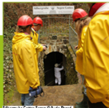
Silbergrube Gottes Segen