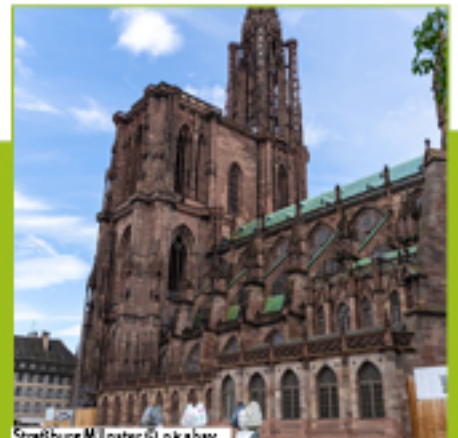
Straßburg Münster