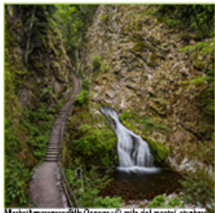
Allerheiligenwasserfälle Oppenau