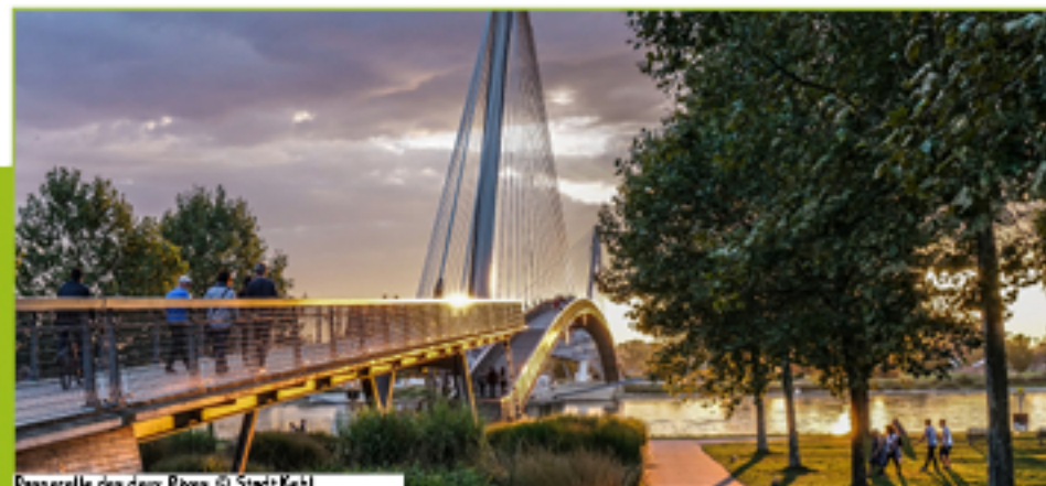
Passerelle des deux Rives