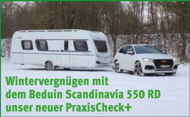
Wintervergnügen mit dem Beduin Scandinavia 550 RD unser neuer PraxisCheck+