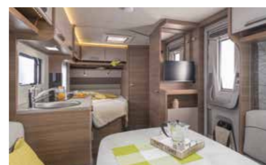
Im 450 FU befinden sich das französische Bett und der Sanitärbereich im Heck des kompakten Reisecaravans

Text: Siegfried Semper / Fotos, Skizzen: Knaus