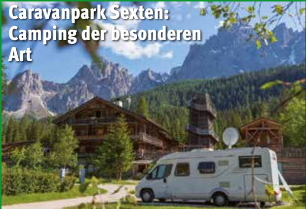
Caravanpark Sexten: Camping der besonderen Art