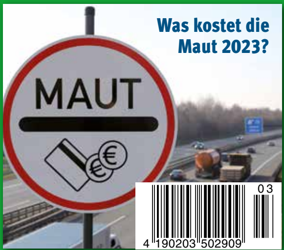
Was kostet die Maut 2023?