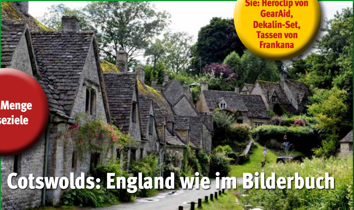
Cotswolds: England wie im Bilderbuch