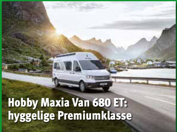
Hobby Maxia Van 680 ET: hyggelige Premiumklasse