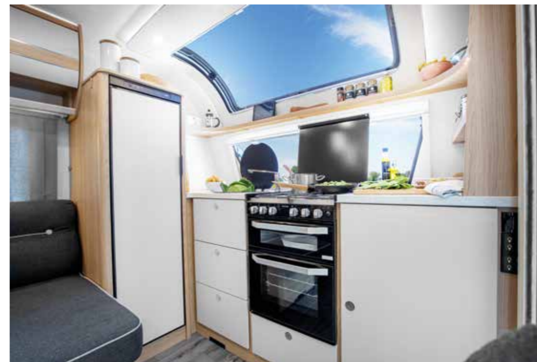
Komfortable Küche im 580 D

Neben den beliebten Kinderzimmer-Modellen 522 K, 530 K und 532 K ergänzen die Paargrundrisse 520 E und 580 D das Angebot. Dabei entpuppt sich der knapp acht Meter lange 580 D als interessante Variante für komfortverwöhnte Paare. Insbesondere die lichtdurchflutete und große Küche quer im Bug ist ebenso erwähnenswert wie der wagenbreite und geräumige Sanitärbereich mit separater Dusche im Heck. In der Mitte befinden sich die bequeme Sitzgruppe mit L-Sitzbank, Seitensitz und Säulentisch sowie das abteilbare Schlafzim-