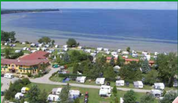
Ostseecamping Ferienpark Zierow – perfekt für Familien