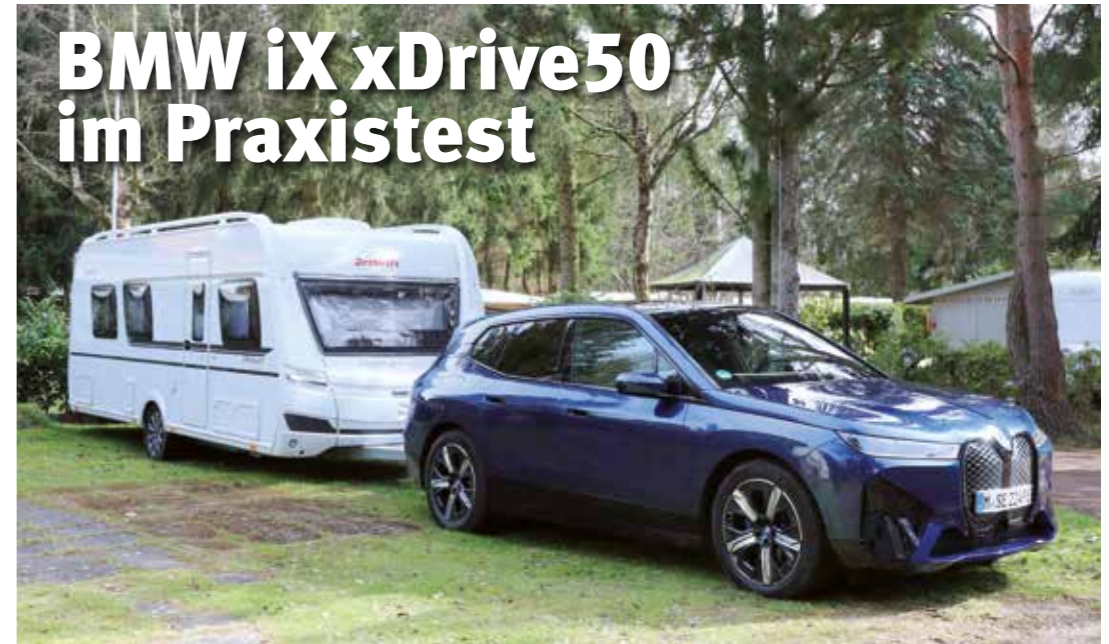
Mit dem PC+ Dauertestcaravan am Haken haben wir verschiedene Streckenprofile ins Visier genommen

Im Gespanntest hängten wir den Dethleffs Beduin Scandinavia 550 RD an den elektrisch aus- und ein-