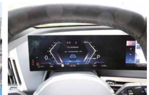
Über das große Display sind alle wichtigen Daten über den Elektrozustand zu sehen

fahrbaren Haken des BMW, dessen effektives Gewicht 1.893 Kilogramm betrug. Zudem wurden im Caravan alle möglichen 12 Volt Verbraucher ausgeschaltet. Als Teststrecken dienten jeweils gut 100 Kilometer lange Abschnitte auf nahezu ebenen Landstraßen und Autobahnen. Während sich auf den Landstraßen der Durchschnittsverbrauch bei 39,3 kWh einpendelte, nahm er auf den Autobahnabschnitten mit 54,8 kWh noch deutlicher zu, zumal auch einige Kilometer im Tempo-100 Bereich gefahren wurden. Das heißt im Ergebnis, dass von der Reichweite von möglichen 630 Kilometer im Solobetrieb nur noch 284 bzw. 203 Kilometer übrig bleiben.