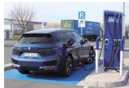
Aussuchen sollte man sich zwar leistungsstarke Ladestationen, die aber auch weniger leisten können