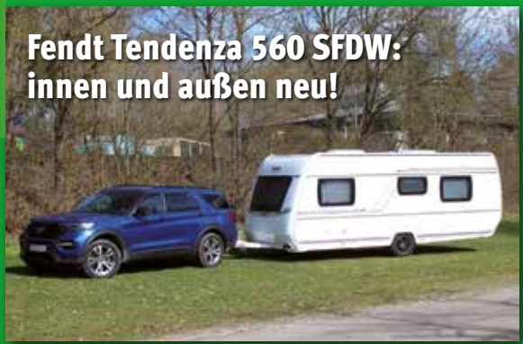
Fendt Tendenza 560 SFDW: innen und außen neu!