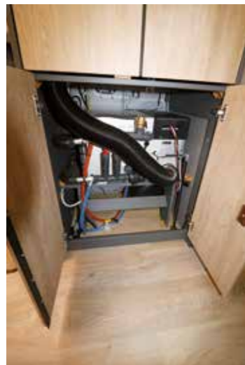
Die Warmwasserheizung befindet sich gut erreichbar unter dem Kleiderschrank