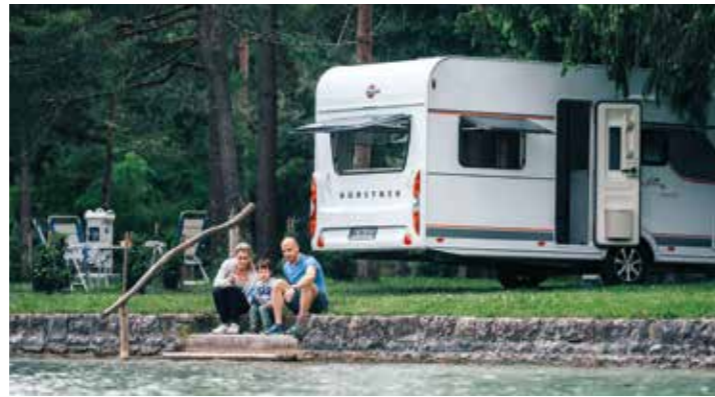
Mobil unterwegs mit Bürstner

Motor: 2.956 ccm, V6-Turbobenziner-Eco-Boost + 75 kW Elektromotor, Systemleistung 336 kW/457 PS bei 5.750 U/min., max. Drehmoment 825 Nm bei 2.500 U/min. Antrieb: Allradantrieb, 10-Gang-Automatikgetriebe. Schadstoffklasse: Euro 6, CO 2 -Emission (WLTP/kombiniert) 71 g/km. Effizienzklasse: A+. Reifen: 255/55 R 20. Fahrwerte: 0-100 km/h 6,1 s, Vmax. 230 km/h. Verbrauch: Testdurchschnitt Solo/Gespann 7,6/9,8 l/100 km, Benzin E 10, Tankinhalt 68 l, Maße/Gewichte: L/B/H 5.076/2.107/1.783 mm, Radstand 3.025 mm, Leergewicht 2.541 kg, Zuladung 619 kg. Anhängelast: (12%) gebr./ungebr. 2.500/750 kg, Gesamtzuggewicht k.A., Stützlast 100 kg. Basispreis: 86.490,- € (ST-Line), Anhängerkupplung abnehmbar 1.200,- €. Stand 6/23