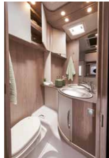
Sanitärbereich mit allem Nötigen

Duschpaneelen, Duschkabinentür sowie Duscharmatur mit Brauseschlauch.