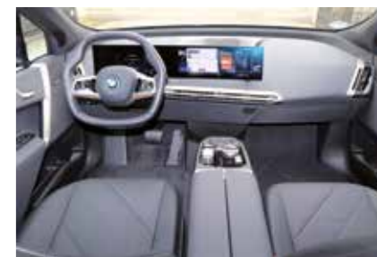
Viel Platz und komfortable Sitze bietet das Cockpit im BMW iX