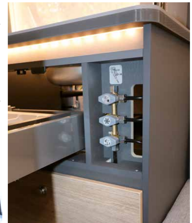
Sicher und zugleich leicht zugänglich: Gasabsperrhähne hinter der Schubladenblende

Als nächsten Kandidaten haben wir den neuen Tabbert Pantiga im Praxis-Check+, der ab Heft 11/23 beginnt.