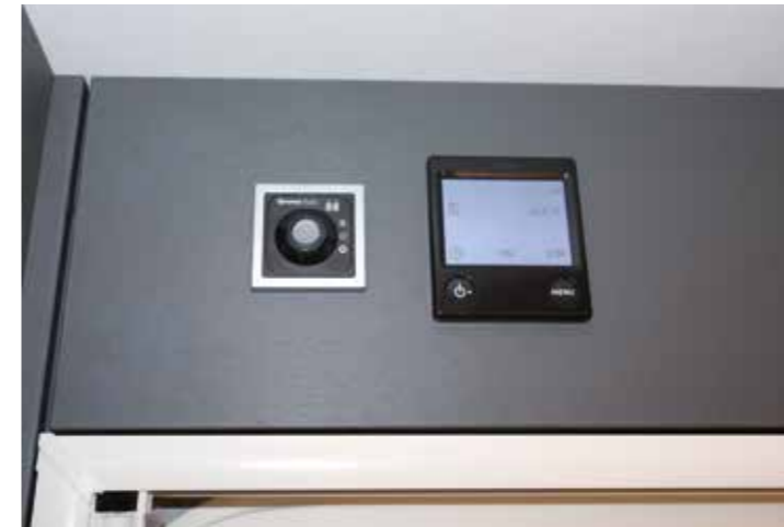
Bedienungsfreundliches LCD-Panel für die Einstellungen der Alde Warmwasserheizung

ogramm pro Rad und 100 Kilogramm Deichsellast zu Buche stehen. Auf die Waage brachte der aufgelastete Testcaravan inklusive der verbauten Extras ein fahrfertiges Gewicht von 1.682 Kilogramm. Bei einer zulässigen Gesamtmasse von 2.000 Kilogramm ergibt sich eine Zuladekapazität von 318 Kilogramm, die einem Zweipersonen-Haushalt noch genug Spielraum für Ausrüstung, Gepäck und Vorräte einräumen. Ebenso lobenswert ist die ausgewogene Gewichtsverteilung, die mit 771 und 817 Kilogramm rechts bzw. links sowie der Stützlast von allerdings recht hohen 94 Kilogramm ermittelt wurden.