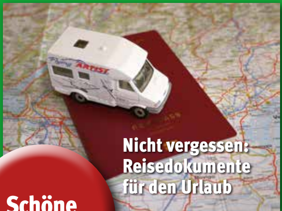
Nicht vergessen: Reisedokumente für den Urlaub