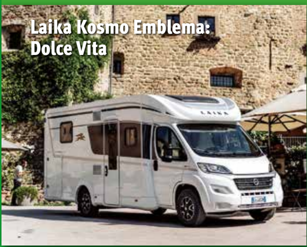
Laika Kosmo Emblemat: Dolce Vita