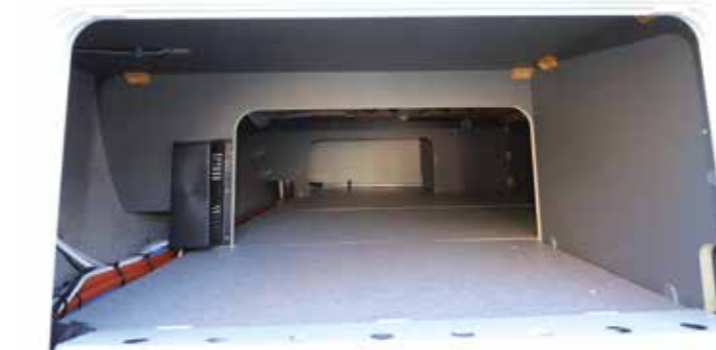
Alle Sitz- und Bettenruhen sind mit zusätzlichen Bodenplatten zur besseren Belüftung bestückt

Alles in allem überzeugt der Beduin Scandinavia 550 RD auf Anhieb in allen Bereichen. Klar auf der Habenseite steht neben dem gemütlichen Wohnbereich auch die insgesamt funktionale Einteilung, die einem Paar beste Vor-